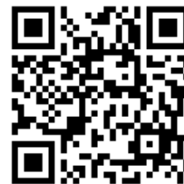
Google 線上報名表 QRcode